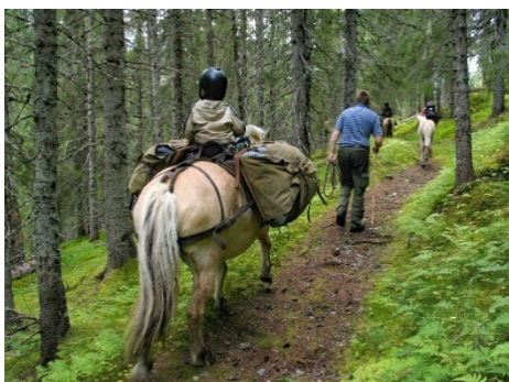
Figur 1: Den gamle Stavassvegen starter ved Laksevollen, der infosenter for skog er tenkt plassert, og går inn til Stavassgården. Stavassdalen er Granes hovedinnfallsport til Lomsdal-Visten Nasjonalpark/Njaarken vaarjelimmiedajve.