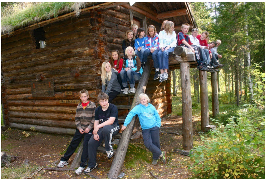
Figur 9: Grane barne og ungdomsskole er flittige brukere av Grane Bygdetun

I tråd med prinsippene «bærekraftige lokalsamfunn», vil senteret utvikle et utdanningsprogram for natur- og kulturguider med særlig vekt på lokal og regional ungdom, både for å kunne sikre kompetanse lokalt, men også for å vekke interesse blant ungdommen og sikre stolthet over lokale natur- og kulturverdier. Dette sørger for lokal forankring av senteret, og er også sentralt for bolyst og naturvern.