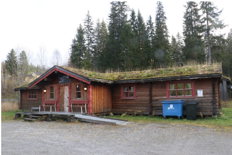
Figur 2: Husflidshytta på Grane Bygdetun - hovedinngang til besøkssenteret 2022-2025

Senterets første fysiske lokasjon vil være på Trofors. Mellom 2023-2025 vil hovedsetet være på Grane Bygdetun i den såkalte «Husflidshytta» (se Figur 2). Hytta er på ca. 90m 2 med universell utforming på både inngang og toalett. Utstillinger vil spres i hovedsak på tre lokasjoner på Trofors. Låven på Bygdetunet, Togstasjonen og Kommunehuset. Disse tre stedene har ulike kvaliteter og muligheter for engasjement og utstillingstyper, og vil nå svært mange ulike målgrupper. Denne løsningen vil sikre en naturlig overgang til et nytt senter, og muligheten til å formidle de samme tilbudene i skogsområdene. Infrastrukturforholdene er de samme, med unntak av at det er Riksveg 73 som i dag går gjennom Trofors.