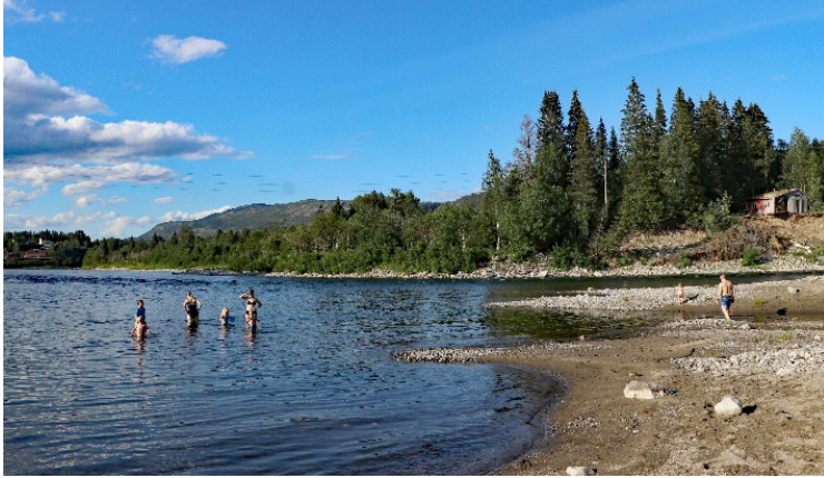
Figur 5: Ei rolig bakevje i Svenningelva er en sentrumsnær og populær badeplass.