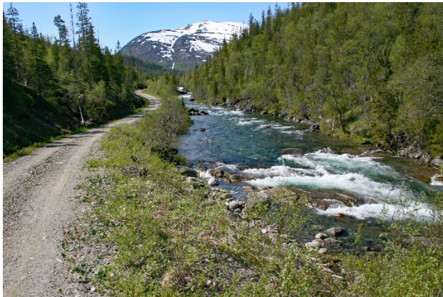
Figur 7: Fra Laksevollen er det fint å sykle inn til Stavassdalen, noe som ofte gjøres av skoleklasser fra Trofors.