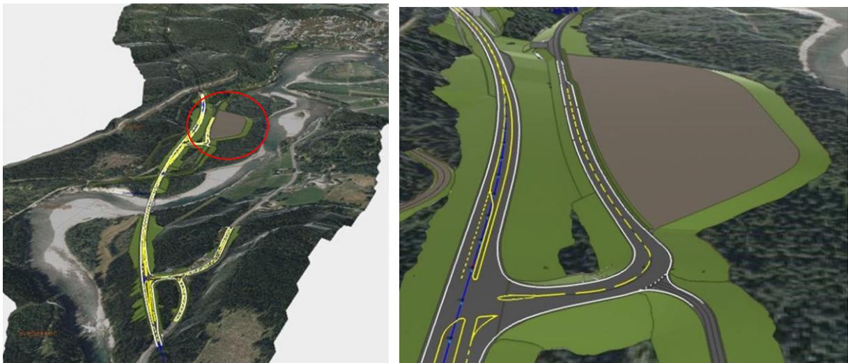
Figur 11: Illustrasjon av det kommende området for lokalisering av Besøkssenter

Det er planlagt turistinformasjon i området, som i seg selv vil være en stoppeeffekt. I tillegg er