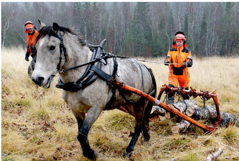
Figur 10: Når "skogklassen" ved studiested Marka er på Stavvassgården får de prøve vedkjøring på gammelmåten.

Lokalbefolkningen vil nås ved at deres tradisjonelle turområder blir bedre tilrettelagt og får høyere kvalitet. Det vil bli enklere å oppdage nye områder, og lære om skogen som ett av fundamentene i Grane og omegns stedsutvikling. Det skal samarbeides tett med friluftsråd og andre frivillige organisasjoner som har lokale medlemmer for å engasjere befolkningen.