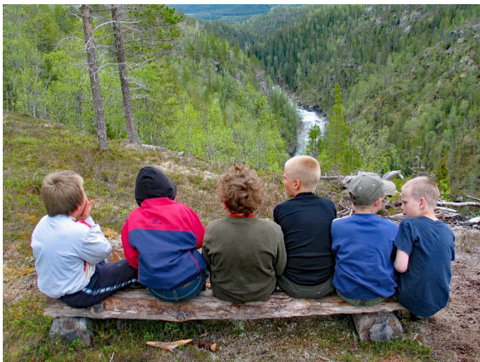
Figur 8: Utsiktspunkt langs den gamle Stavvassvegen ned i elvegjelet med Stavvasselva, og med naturreservat på en andre sida av elva.

Senteret vil ha tiltak og aktiviteter som passer samtlige av målgruppene definert i veilederen. Likevel er det noen målgrupper senteret vil ha større fokus på enn andre: