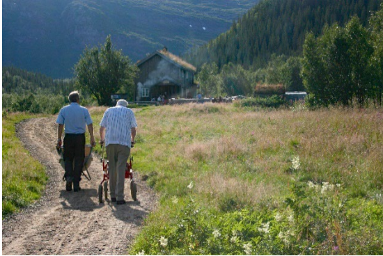
Figur 12: Stavassgården

Besøkssenterets hovedsete for 2023-2025 ligger på Grane Bygdetun, og er universelt utformet ved både inngangsparti og toalettfasiliteter. Øvrige utstillingslokaler er også utformet for tilgjengelighet, og vil kunne tilpasses ulike typer brukere. Kommunehuset, togstasjonen og Bygdetunet følger retningslinjer for universell utforming.