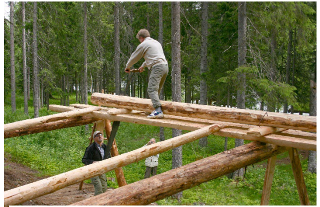
Figur 6: På Grane bygdetun kan man få innblikk i tidligere tiders tilvirking av material. Sagstilling for håndsaging av plank, og tilvirking av plank med øks.